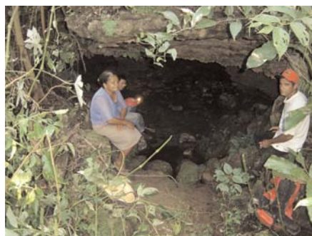
Caverna calcária na região do Igarapé Jibóia

cavernas foram cadastradas nesta área. A região de Arixi (margem direita do Tapajós) teve apenas uma cavidade cadastrada, mas um jacaré alojado em trecho alagado do conduto impediu a exploração. As regiões de Capitoã e Laranjo não foram examinadas por falta de tempo e dificuldades de acesso. Várias cavernas areníticas foram também cadastradas, incluindo uma belíssima cavidade com mais de 1 km de desenvolvimento. Um retorno é planejado para breve.